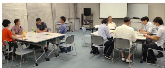
起業カフェの風景