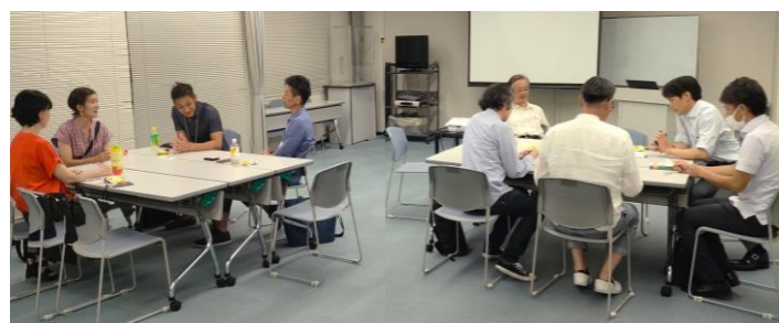
起業カフェの風景