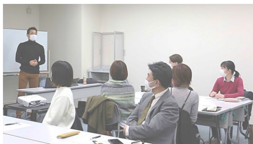
起業カフェの風景